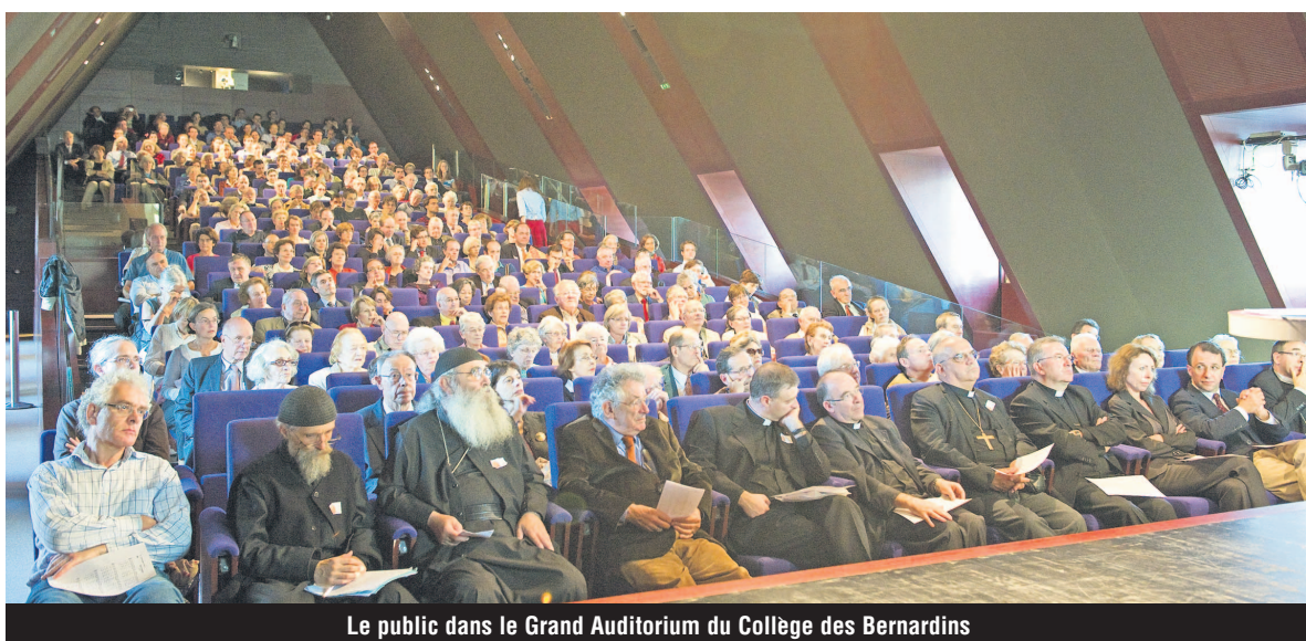
Le public dans le Grand Auditorium du Collège des Bernardins