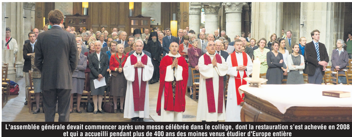
L'assemblée générale devait commencer après une messe célébrée dans le collège, dont la restauration s'est achevée en 2008 et qui a accueilli pendant plus de 400 ans des moines venus étudier d'Europe entière